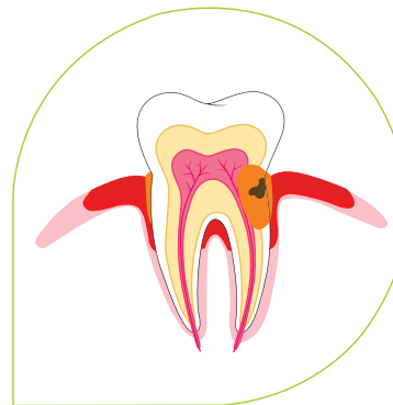
zub ohrožený parodontózou

ZUBNÍ PREVENCE Vám naopak za nepoměrně nižší částku zajistí, že tyto náklady pravděpodobně nikdy nebudete muset hradit. Zubní kazy a parodontóza pro Vás budou jen vzdálené pojmy, o kterých mluví ti ostatní. Zároveň si do budoucna zajistíte možnost používat vlastní zdravé zuby i ve vysokém věku, bez obav z nezdravého dechu a nutnosti „ukrývání“ zubní protézy.